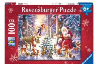
Puzzle Noël en forêt 100 pièces, format XXL, dès 6 ans.

Le calendrier de l'Avent GraviTrax 2022 réserve chaque jour une surprise sous forme de briques d'action ainsi que les éléments de construction d'un circuit spécial «Noël». Il s'agit d'un best-of de l'univers GraviTrax – les constructeurs de 8 ans et plus peuvent également se réjouir de quelques nouveautés. Les 24 surprises ne nécessitent pas de connaissances préalables particulières, le plaisir de jouer peut commencer immédiatement.