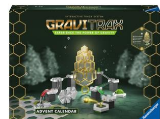
Calendrier de l'Avent GraviTrax Avec 24 surprises, dès 8 ans.