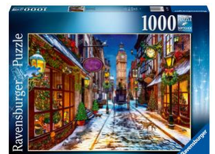
Puzzle Noël 1000 pièces, dès 12 ans