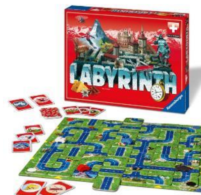
Labyrinthe Swiss Edition Pour 2 – 4 joueurs dès 7 ans

La famille de jeux Labyrinthe fait partie des jeux familiaux les plus appréciés et les plus vendus de la maison d'édition Ravensburger. Dans l'édition suisse, il s'agit d'atteindre des curiosités et des objets typiquement suisses en déplaçant habilement la carte routière. Cela garantit des rencontres conviviales et du suspense jusqu'au bout.