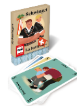
Jeu de cartes: La lutte suisse Pour 2 joueurs dès 8 ans