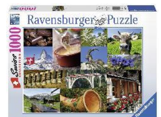
Puzzle Swissness 1000 pièces, dès 14 ans