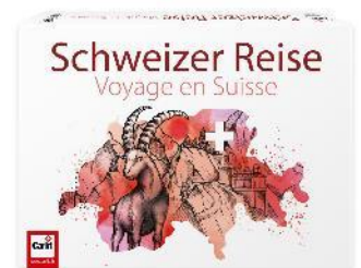
Carlit Voyage en Suisse Une course ludique dès 8 ans

Le puzzle «Swissness» montre la Suisse sous son plus beau jour. L'expérience tactile des puzzles enthousiasme de plus en plus de personnes de tous âges. La concentration exigée par la recherche de la bonne pièce a pour beaucoup quelque chose de méditatif et procure des moments de détente bienfaisants. Un cadeau parfait – pas seulement pour les amateurs de puzzles.