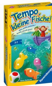
Allez, petits poissons! Jeu de dés pour 2 à 6 joueurs dès 3 ans Prix de vente recommandé: Fr. 9.95