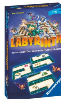
Labyrinth jeu de cartes Pour 2 à 6 joueurs dès 7 ans Prix de vente recommandé: Fr. 9.95

Des villageois apparemment inoffensifs se transforment en loups-garous la nuit. Les habitants découvriront-ils qui fait partie de la meute de loups-garous? Dans un jeu de rôle au rythme effréné, il est possible de bluffer, de tricher et de dissimuler. Un joueur joue le rôle d'animateur, ce qui est encore plus amusant grâce à l'application gratuite de meneur de jeu.