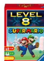
Super Mario – Level 8 Jeu de cartes dès 8 ans Prix de vente recommandé: Fr. 13.50