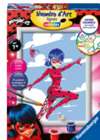
Numéro d'Art – Miraculous Pour les enfants dès 7 ans Prix de vente recommandé: Fr. 19.50