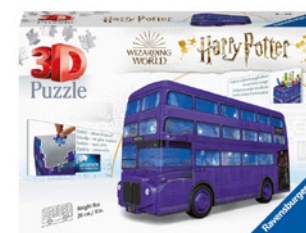
Puzzle 3D Knight Bus Harry Potter 216 pièces de puzzle numérotées dès 8 ans Prix de vente recommandé: Fr. 48.50