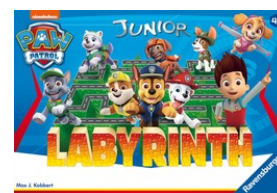
Labyrinthe La Pat'Patrouille Junior Jeu de plateau dès 4 ans Prix de vente recommandé: Fr. 39.50