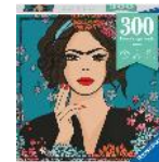
Puzzle Frida de la série Puzzle Moments

1000 pièces, dès 14 ans Prix de vente recommandé: Fr. 20.50