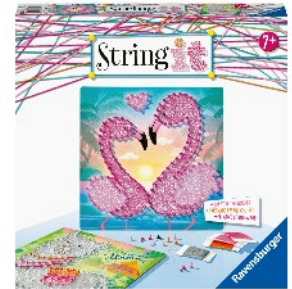
«String it» Midi: Lama & Flamingo dès 7 ans Prix de vente recommandé Fr.22.50

les lamas et les flamants roses font fureur sur les sacs, les verres, les rideaux et même sur les bouées XXL! Ils existent maintenant aussi sous forme de tableaux à fil. Le String Art est super tendance et avec les produits «String it» de Ravensburger, c'est très simple. Pour ce faire, les enfants insèrent simplement des pins colorés au dos du modèle dans des trous pré-perforés de la même couleur. Ils retournent ensuite le support et nouent des fils colorés qui s'entrecroisent autour des épingles jusqu'à ce que le motif souhaité soit créé.