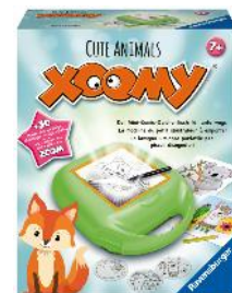
Xoomy Midi: Cute Animals dès 7 ans Prix de vente recommandé Fr. 34.50

Carlit+Ravensburger AG est une filiale indépendante de Ravensburger Spielverlag GmbH en Allemagne. En Europe, Ravensburger est une des marques leader pour les puzzles, les jeux et les produits d'occupation, et pour les livres pour enfants et adolescents dans les pays germanophones. Les jeux dotés du triangle bleu sont vendus dans le monde entier et produits à 85% dans les usines de la marque. de la marque. Les marques très appréciées Carlit®, BRIO® et Thinkfun® font également partie du Groupe Ravensburger.