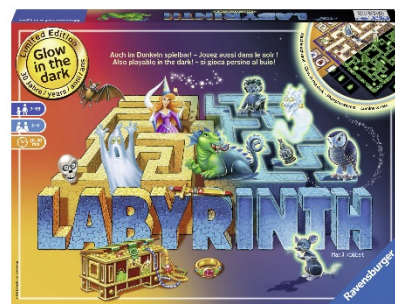
Labyrinthe 30 ans Edition anniversaire pour 2 à 4 joueurs dès 7 ans Prix de vente conseillé Fr. 34.95

Labyrinthe est un jeu familial classique pour 2 à 4 joueurs dès 7 ans avec deux variantes: l'original datant de 1986 et le labyrinthe lumineux pour une partie dans l'obscurité.