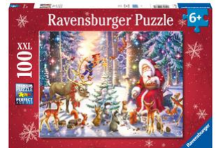
Puzzle Waldweihnacht 100-teilig, XXL-Format, ab 6 Jahren