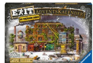
Exit Adventskalender «Die verlassene Fabrik» Mit 24 kniffligen Rätseln, ab 10 Jahren