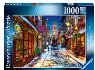
Puzzle Weihnachtszeit 1000-teilig, ab 12 Jahren