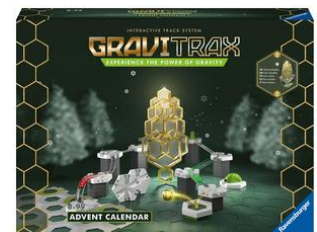
GraviTrax Adventskalender Mit 24 Überraschungen, ab 8 Jahren