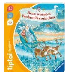
tiptoi® Meine schönsten Weihnachtsmärchen Liebevoll illustriertes Buch mit Hörspielen, ab 4 Jahren