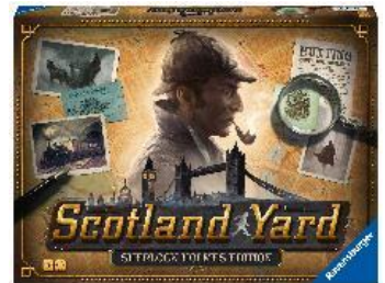
Scotland Yard Sherlock Holmes Edition Detektivspiel für 2–6 Personen ab 10 Jahren.

Das neue kooperative Brettspiel für die ganze Familie zum weltbekannten Videospiel-Phänomen „Minecraft“! Die Spieler versuchen gemeinsam, ein verlassenes Dorf wieder aufzubauen, bevor die feindlichen „Illager“ sie angreifen können. Dafür erkunden sie spannende Biome, sammeln wichtige Ressourcen und kämpfen gegen gefährliche Monster. Nur gemeinsam und mit der Unterstützung ihrer treuen tierischen Begleiter können sie die „Illager“ vom Angriff abwehren! „Minecraft Heroes of the Village“ schafft mit kurzen Spielrunden einen leichten Einstieg in die Minecraft-Spielewelt.