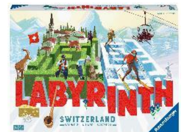
Labyrinth Switzerland Familien-Spieleklassiker für 2–4 Personen ab 7 Jahren.