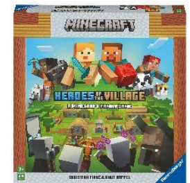
Minecraft Heroes of the Village Kooperatives Familienspiel für 2–4 Personen ab 7 Jahren.