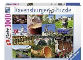
Puzzle Swissness 1000 Teile ab 14 Jahren