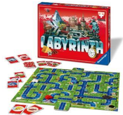
Labyrinth Swiss Edition Für 2–4 Spieler ab 7 Jahren

Die Labyrinth-Spielfamilie gehört zu den beliebtesten und meistverkauften Familienspielen aus dem Ravensburger Spieleverlag. Bei der Swiss Edition gilt es, typische Schweizer Sehenswürdigkeiten und Gegenstände durch geschicktes Verschieben der Strassenkarte zu erreichen. Das garantiert geselliges Beisammensein und Spannung bis zum letzten Spielzug.