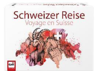
Carlit Schweizer Reise Laufspiel ab 8 Jahren

Das Puzzle «Swissness» zeigt die Schweiz von ihrer schönsten Seite. Das haptische Erlebnis des Puzzelns begeistert immer mehr Menschen jeden Alters. Die Konzentration auf das passende Teilchen hat für viele etwas Meditatives und verschafft wohlthuende Momente der Entspannung. Ein perfektes Geschenk – nicht nur für Puzzle-Fans.