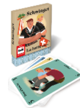
Kartenspiel Schwinget Für 2 Spieler ab 8 Jahren