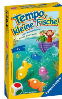
Tempo, kleine Fische Würfelspiel für 2 bis 6 Spieler ab 3 Jahren empf. Verkaufspreis: Fr. 9.95