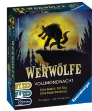
Werwölfe Vollmondnacht Bluffspiel für 3 bis 10 Spieler ab 9 Jahren empf. Verkaufspreis: Fr. 17.50

Ebenfalls im praktischen Kleinformat erhältlich: die beliebten Spieleklassiker wie beispielsweise Scotland Yard, La Cucaracha, Lotti Karotti oder Make 'n' Break und viele mehr.