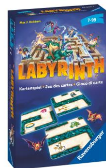
Labyrinth Kartenspiel Für 2 bis 6 Spieler ab 7 Jahren empf. Verkaufspreis: Fr. 9.95

Scheinbar harmlose Dorfbewohner verwandeln sich nachts in Werwölfe. Finden die Bewohner heraus, wer zum Werwolfsrudel gehört? In einem rasanten Rollenspiel geht's zur Sache und es darf geblufft, getrickst und vertuscht werden. Jeweils ein Spieler übernimmt jetzt die Rolle des Moderators, was dank kostenloser Spielleiter-App noch mehr Spass macht.