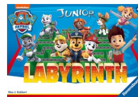
Paw Patrol Junior Labyrinth Brettspiel ab 4 Jahren empf. Verkaufspreis: Fr. 39.50