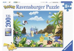
Pokémon Kinderpuzzle 200-teilig ab 6 Jahren empf. Verkaufspreis: Fr. 15.95

Sie ist die Heldin der Metropole Paris, rettet die Stadt vor deren Bösewichten und studiert nebenbei an der Modeschule. Ladybug und ihre Freunde haben auch Ravensburger-Puzzles und Kinderspiele wie Malen nach Zahlen erobert – c'est chic.