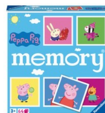
Peppa Pig memory® 32-teilig ab 3 Jahren empf. Verkaufspreis: Fr. 19.50

Der liebenswürdige italienische Klempner aus Brooklyn ist längst dem bekannten Videospiel entsprungen. Zusammen mit seinen Freunden hat er die haptische Spielwelt erobert und begeistert nicht nur seine Fans. Der schnauzbärtige Kerl mit der typisch roten Schirmmütze posiert auf qualitativ hochstehenden Puzzles, dem Spiele-Klassiker Labyrinth oder dem Kartenspiel Level 8. Das bringt Spielspass für die ganze Familie.