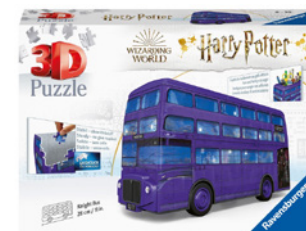
3D Puzzle Knight Bus Harry Potter 216 nummerierte Puzzleteile ab 8 Jahren empf. Verkaufspreis: Fr. 48.50