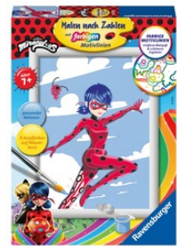
Miraculous Malen nach Zahlen Für Kinder ab 7 Jahren empf. Verkaufspreis: Fr. 19.50