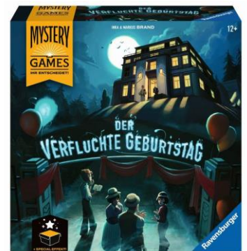
Der verfluchte Geburtstag Rätsel-Spiel für 2–4 Personen ab 12 Jahren empf. Verkaufspreis: CHF 33.50