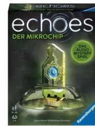
echoes – Der Mikrochip audiodigitales Mystery-Game für 1–6 Personen ab 14 Jahren empf. Verkaufspreis: CHF 12.50

In «Cold Case» von Thinkfun nehmen die Spielenden die Fährte auf, um einen Jahrzehnte alten Mordfall zu lösen. Noch immer läuft der Täter frei herum. Schaffen es die Spielerinnen und Spieler, den Fall so zu kombinieren, dass sie den Mordfall endlich aufklären können? Mit der neuen Cold Case-Reihe schlüpft man selbst in die Ermittlerrolle und stützt sich dabei auf Hinweise, Beweismittel und Indizien aus der dicken Polizeiakte. Bislang erschienen: «Eine Prise Mord» und «Eine todsichere Geschichte».