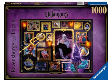
Disney Villainous Puzzles, 1000 Teile ab 14 Jahren.

Wer noch nicht genug hat von Disney-Bösewichten, kann sich an ein fieses 1000-teilitiges Disney Villainous Puzzle wagen und den inneren Schurken entfesseln. Erhältlich sind die Puzzles mit acht verschiedenen Motiven – von Captain Hook über Maleficent bis zu Ursula. Die Puzzles zeigen, wie faszinierend und facettenreich Disney-Bösewichte sind. Denn sie verfügen nicht nur über eine Portion Humor, sondern sind auch beherzt und am Ende lernen wir selbst die schlimmsten Missetäter lieben.