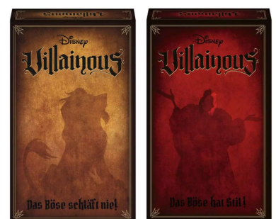
Erweiterungen 2 und 3: «Disney Villainous – Das Böse schläft nie» und «Das Böse hat Stil» für 2–3 Spieler ab 10 Jahren.