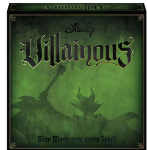
Disney Villainous, Strategiespiel für 2–6 Spieler ab 10 Jahren.

Das Strategiespiel «Disney Villainous» hat vergangenen Frühling die dritte Erweiterung erhalten. In «Disney Villainous – Das Böse hat Stil» kann man nun in die Rollen der drei stilvollen Disney-Bösewichte Cruella de Vil aus «101 Dalmatiner», Mutter Gothel aus «Rapunzel – Neu Verhöhnt» und Kater Karlo aus «Steamboat Willie» schlüpfen, um das Böse zum Erfolg zu führen.