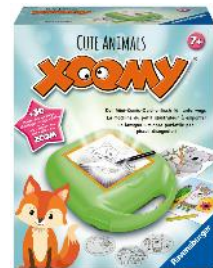
Xoomy Midi: Cute Animals ab 7 Jahren empf. Verkaufspreis Fr. 34.50