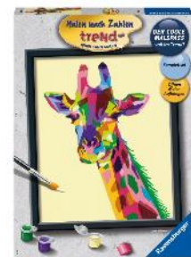
Malen nach Zahlen: Bunte Giraffe ab 12 Jahren empf. Verkaufspreis Fr. 32.95