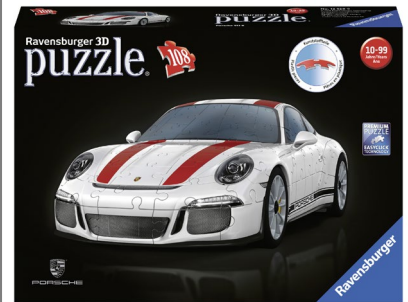
3D-Puzzle Porsche 911 GT3 Cup 108-teilig, Massstab 1:18, ab 10 Jahren. Ungefäher Verkaufspreis Fr. 39.95

Die Werwölfe sind wieder los! Im neuen Ratespiel mit Werwolf, Seherin und Co. hat die Dorfgemeinschaft 5 Minuten Zeit, gemeinsam das Zauberwort zu erraten. Aber Vorsicht: Die Werwölfe versuchen in die Irre zu führen. Mit sieben spannenden Rollen und immer neuen Begriffen ein Ratespiel wie kein anderes! Zudem liefert die kostenlose App 10 000 Begriffe zum Raten und Mitfiebern!