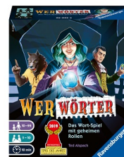
Werwörter Für 3–10 Spieler ab 10 Jahren Ungefäher Verkaufspreis: Fr. 17.95