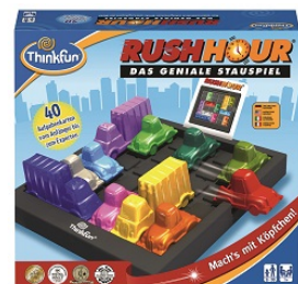
Rush Hour® Für 1 Spieler ab 8 Jahren. Ungefäher Verkaufspreis: Fr. 30.95